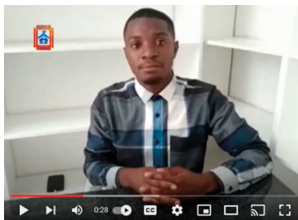
Civil Society Pleads With Govt For Policies To Attract Young People To Venture Into Agriculture

Des engagements fructueux ont été pris avec le Parlement et les principaux médias du