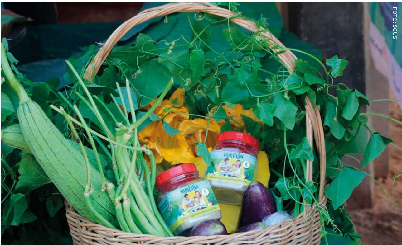
Una canasta de alimentos preparada para la campaña del programa “Alimentar y Cultivar Juntos” en Camboya

Lograr esta misión implica revisar las prioridades actuales de la RSC SUN, abordar las lagunas y aprovechar las fortalezas como colectivo. En los próximos cinco años, la Red tratará de alcanzar los objetivos estratégicos descritos a continuación, que creemos resultarán en el logro de la misión de la RSC SUN y contribuirán, a su vez, a la visión general del Movimiento SUN. Los resultados son las medidas que la Red tomará para alcanzar los objetivos estratégicos y las implementarán principalmente los miembros de la RSC. Los facilitadores transversales son clave para lograr de manera coherente esos resultados y los ejecutará principalmente el Secretariado de la RSC. Como en el caso de todas las iniciativas del Movimiento SUN, la colaboración con otras estructuras y actores de SUN es clave para el éxito, y esto se refleja en la estrecha alineación entre la teoría del cambio de la RSC 3.0 y los objetivos estratégicos descritos en la estrategia general de la tercera fase del Movimiento SUN.