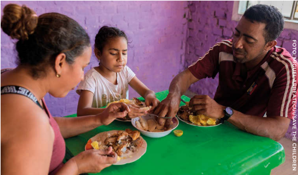
Una familia desplazada de Venezuela almuerza en su casa en Perú