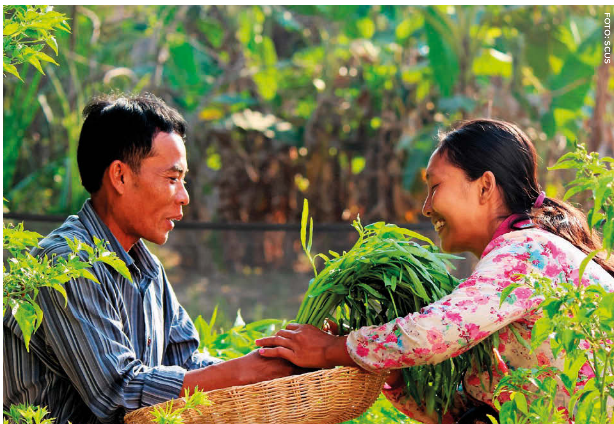
Cultivos que se cosechan para la campaña del programa “Alimentar y Cultivar Juntos” en Camboya