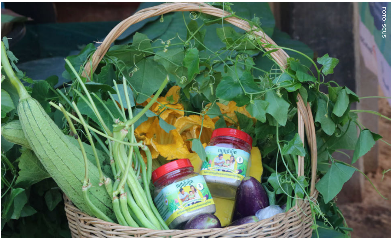
Una canasta de alimentos preparada para la campaña del programa “Alimentar y Cultivar Juntos” en Camboya

Lograr esta misión implica revisar las prioridades actuales de la RSC SUN, abordar las lagunas y aprovechar las fortalezas como colectivo. En los próximos cinco años, la Red tratará de alcanzar los objetivos estratégicos descritos a continuación, que creemos resultarán en el logro de la misión de la RSC SUN y contribuirán, a su vez, a la visión general del Movimiento SUN. Los resultados son las medidas que la Red tomará para alcanzar los objetivos estratégicos y las implementarán principalmente los miembros de la RSC. Los facilitadores transversales son clave para lograr de manera coherente esos resultados y los ejecutará principalmente el Secretariado de la RSC. Como en el caso de todas las iniciativas del Movimiento SUN, la colaboración con otras estructuras y actores de SUN es clave para el éxito, y esto se refleja en la estrecha alineación entre la teoría del cambio de la RSC 3.0 y los objetivos estratégicos descritos en la estrategia general de la tercera fase del Movimiento SUN.