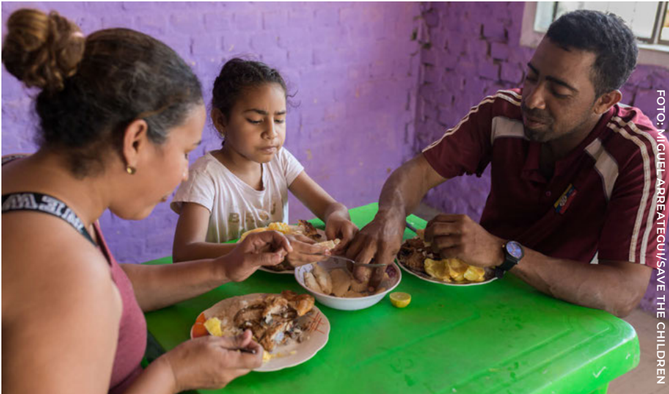
Una familia desplazada de Venezuela almuerza en su casa en Perú